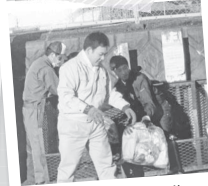
大晦日恒例ごみ収集

環境厚生委員長として、 ごみ処理問題や地域医療・ 子育て支援に傾注予算委員長に抜てき!