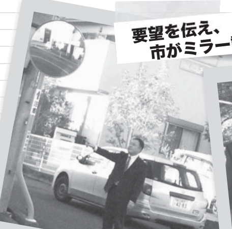
要望を伝え、 市がミラー設置