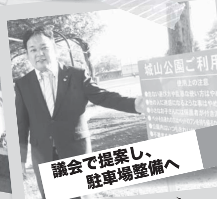
議会で提案し、 駐車場整備へ