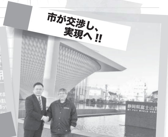
市が交渉し、 実現へ!!