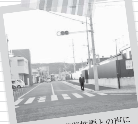
地元から道路拡幅との声に